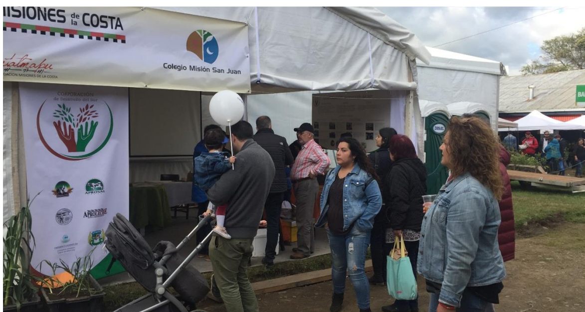
Imagen 9: Stand Corporación de Desarrollo del Sur en SAGO FISUR 2018

Los colegios que participaron fueron Quilacahuín con su especialidad silvoagropecuaria y Misión San Juan con la especialidad de gastronomía. También se sumó a esta articulación la Fundación América Solidaria.