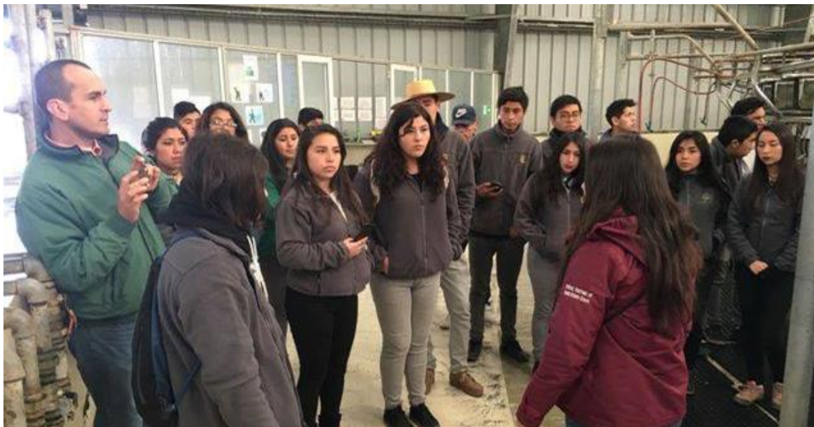
Imagen 7: Alumnos Colegio Quilacahuín visitando la sala de ordeña de Lácteos Tronador

Respecto de las visitas a terreno, durante el 2018, éstas fueron realizadas de acuerdo con los requerimientos de la dirección del colegio. La única visita que se realizó durante este año 2018 fue a Fundación Tronador, en donde pudieron visitar las instalaciones de la lechería y las del Haras.