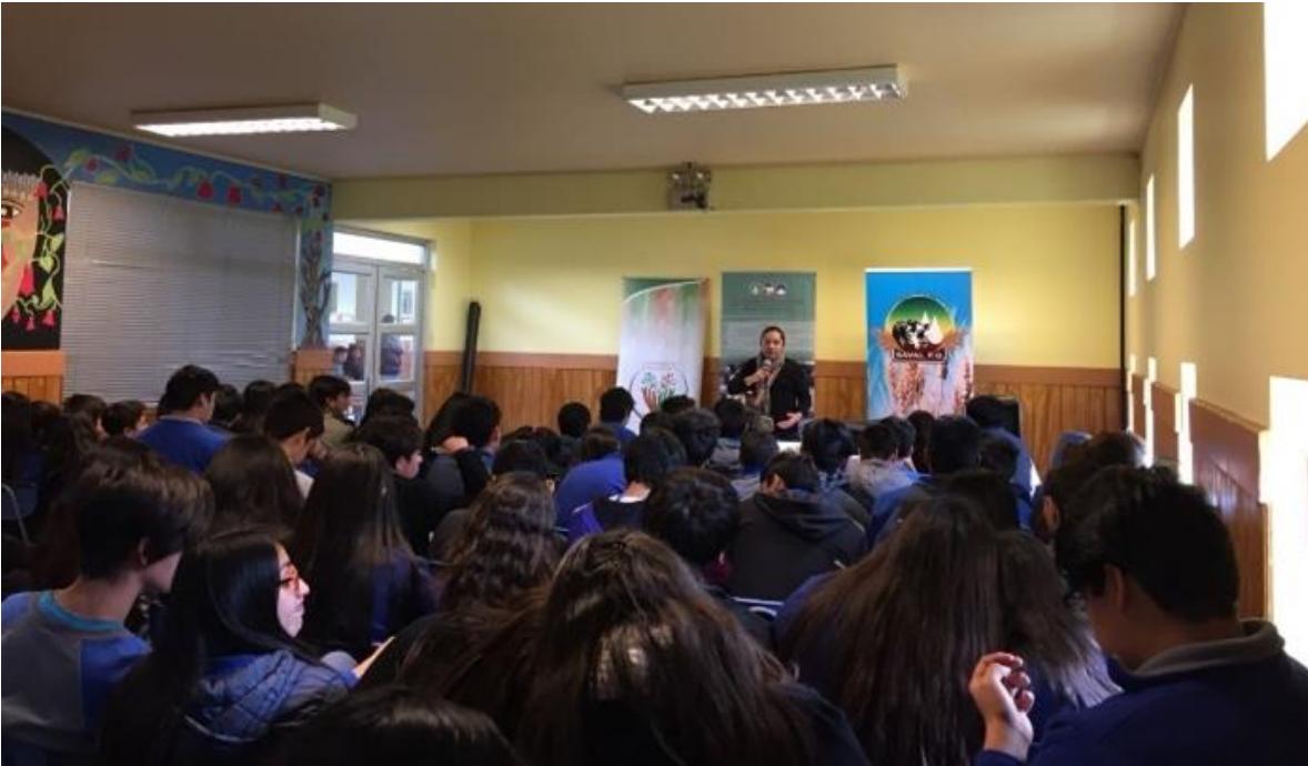
Imagen 11: Charla Motivacional Tenor Pehuenche Complejo Educacional Ignao, Lago Ranco, Región de Los Ríos

La charla congregó a alumnos desde octavo año a cuarto medio, junto al profesorado, en donde no sólo hubo relato de vida, sino que, además, se combinó con música clásica y tradicional. A continuación, se presentan algunos registros de la actividad.