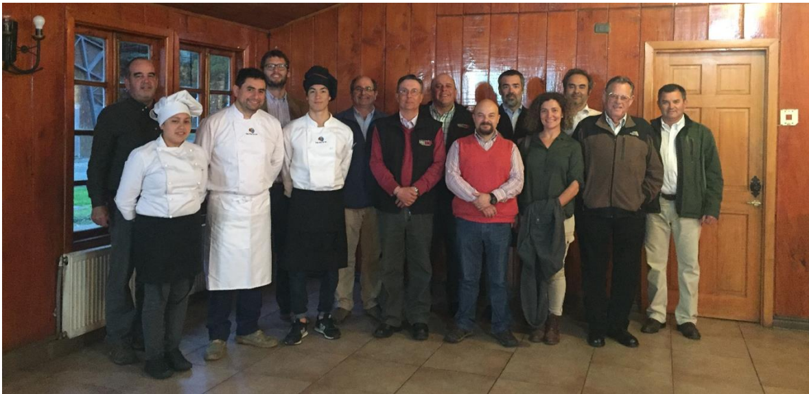
Imagen 8: Última reunión de directorio del año 2018 con el apoyo de los alumnos y profesorado del Colegio Misión San Juan.

Otras instancias de apoyo al Colegio Misión San Juan, ha sido poder contar con el servicio gastronómico en las reuniones de directorio que ameritan visibilizar la labor que realiza el profesorado del colegio.