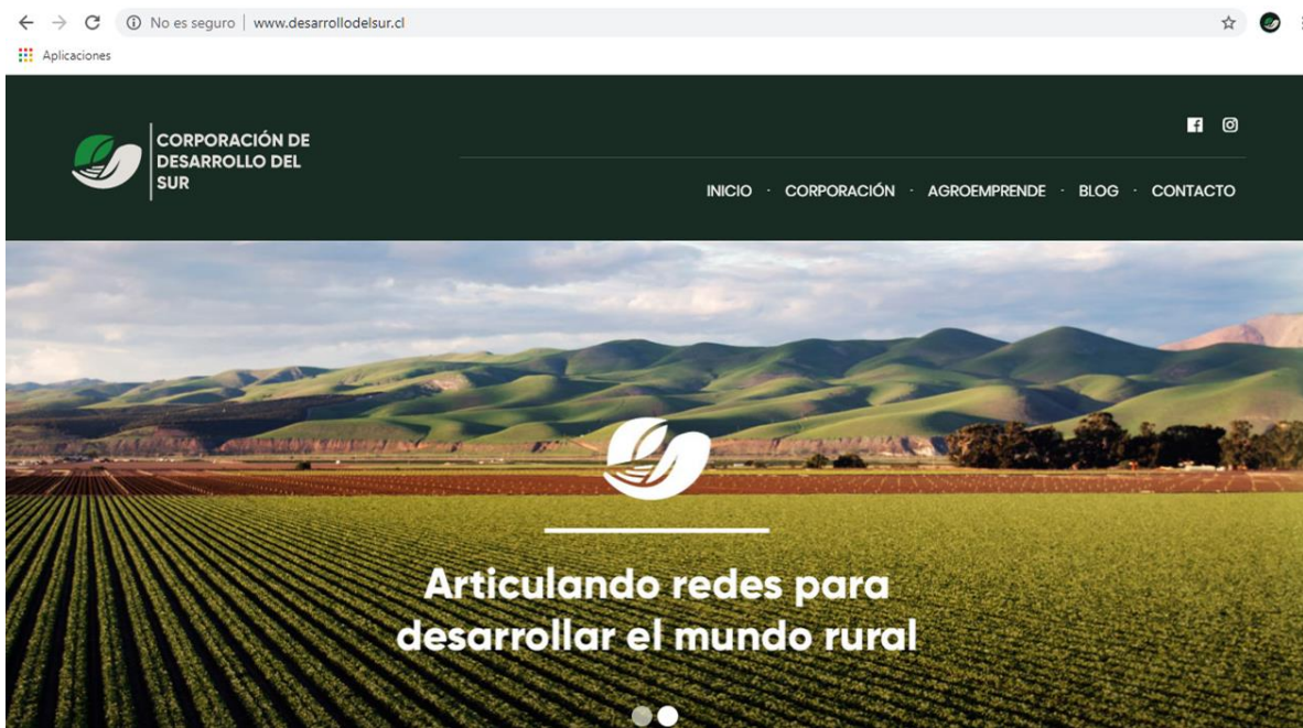
Imagen 2: Visualización página web Corporación de Desarrollo del Sur