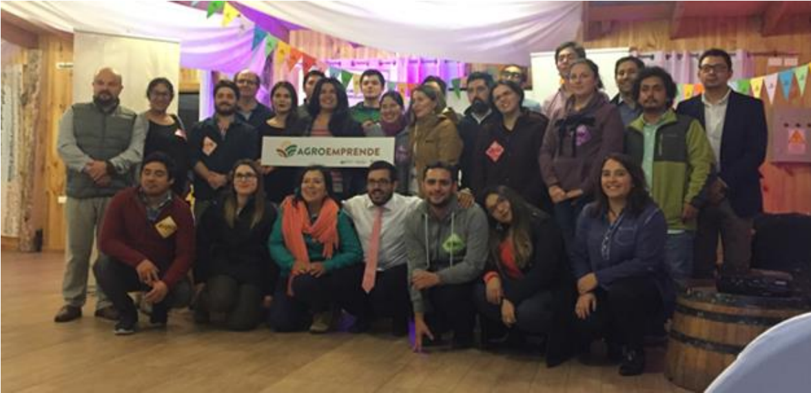
Imagen 14: Comunidad de Jóvenes Programa Agroemprende Los Ríos