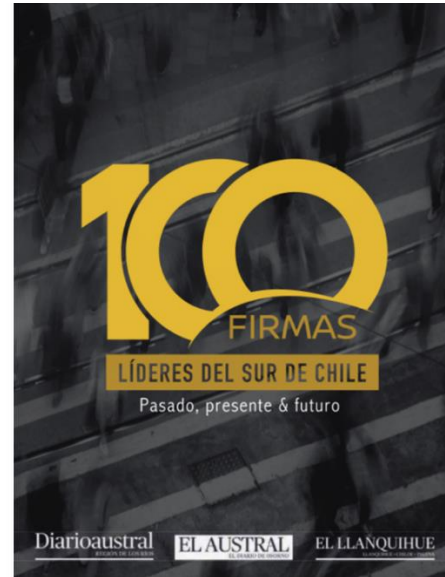
Imagen 6: Publicación “100 firmas Líderes del Sur de Chile” Corporación de Desarrollo del Sur