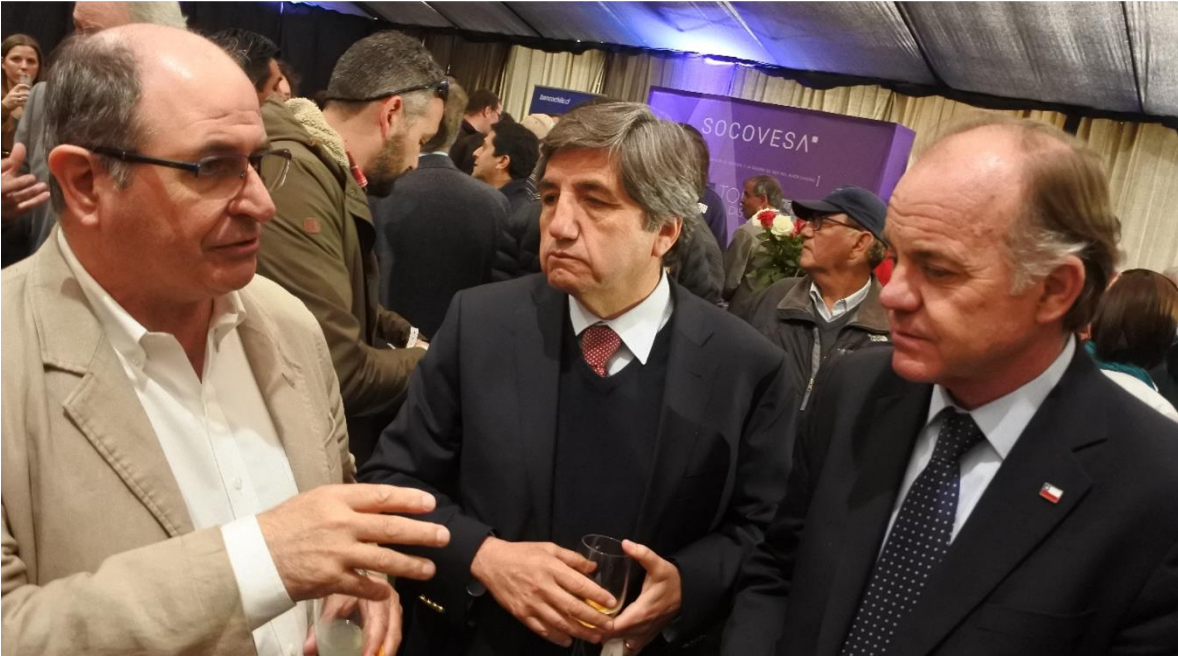
Imagen 10: El Presidente de la Corporación de Desarrollo del Sur, en conversaciones con el Ministro y el Director Nacional de Indap.