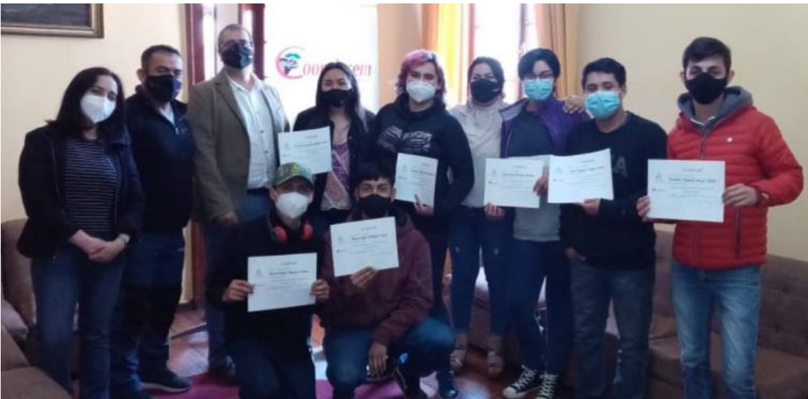
Imagen 11: Certificación de alumnos del Liceo Bicentenario Adolfo Matthei de Osorno en Técnicas de Inseminación Artificial en Ganado Bovino