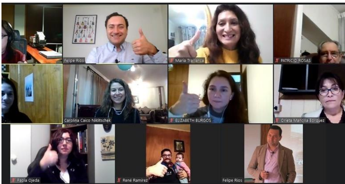
Imagen 1: Participación docente en charla sobre Neuroliderazgo, Neuroeducación y herramientas digitales

Se logra con esta actividad la participación de 20 docentes de nueve establecimientos educativos ligados a la educación técnico profesional de ambas regiones.