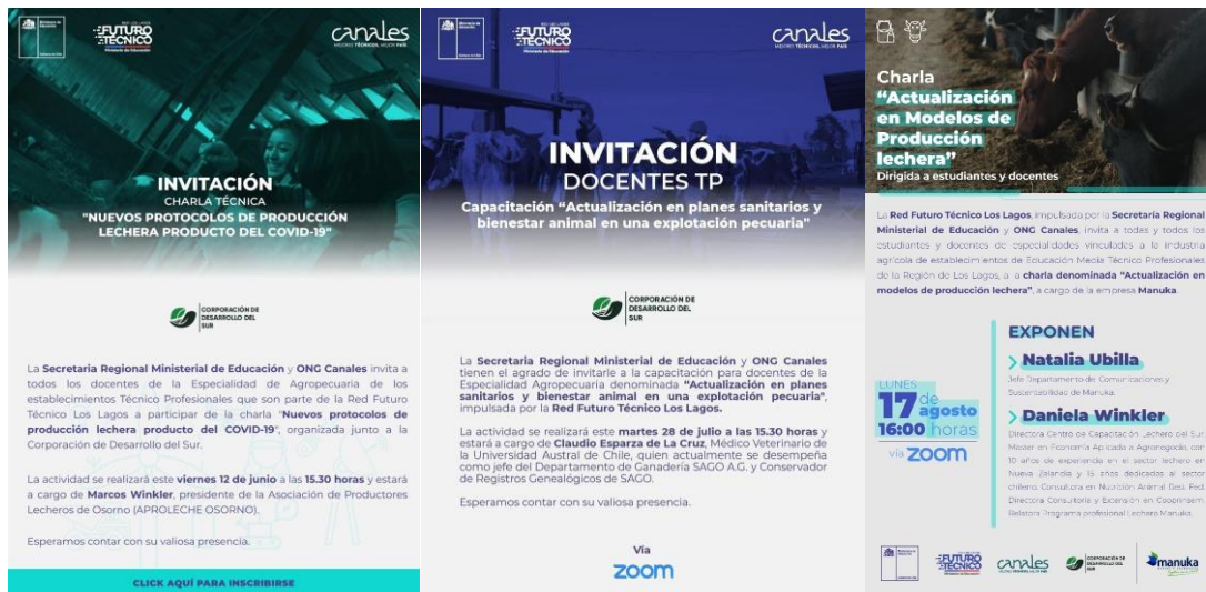
Imagen 4: Afiche promocional de las actividades con la Red Futuro Técnico y ONG Canales la Red

c) Y la tercera actividad fueron las charlas motivacionales para los alumnos de segundo medio de estos establecimientos, con el fin de orientar la elección de la especialidad.