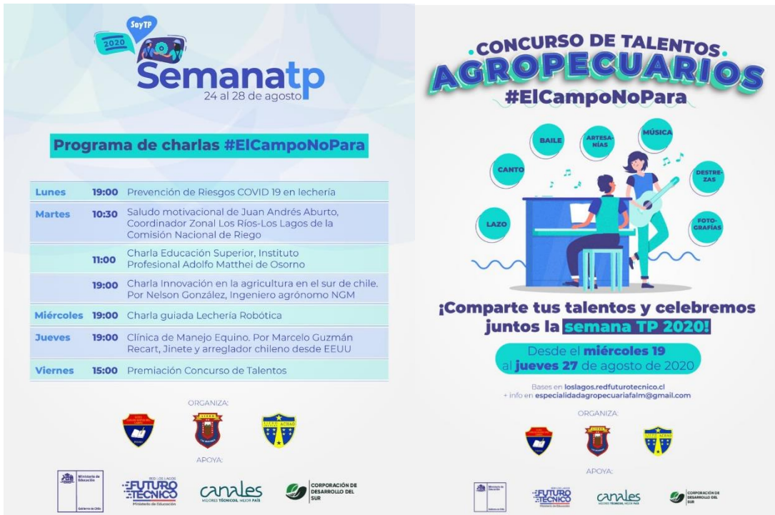
Imagen 7: Afiches promocionales de las actividades Semana TP