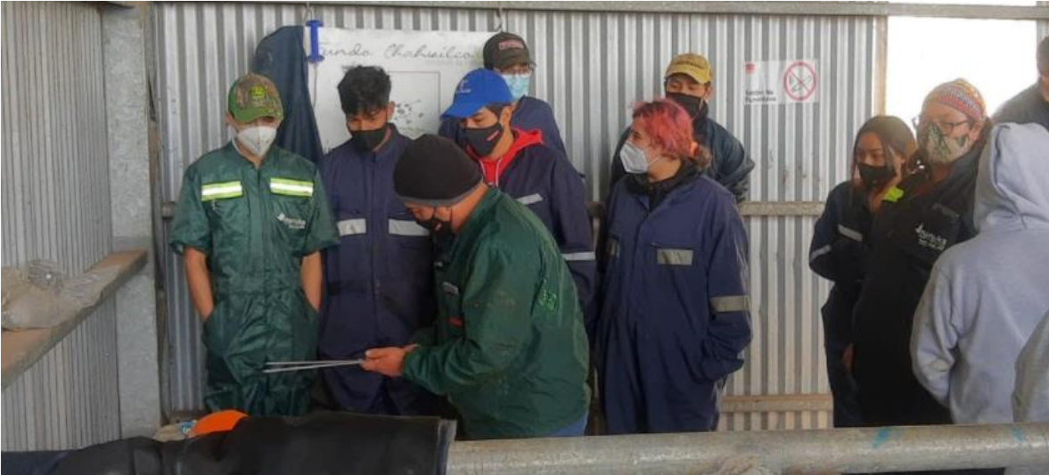
Imagen 10: Técnicas de Inseminación Artificial en Ganado Bovino