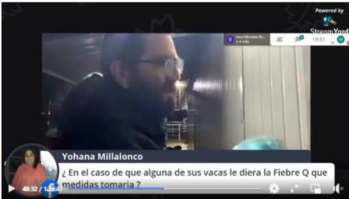
Imagen 8: Visita guiada a lechería robótica Semana TP