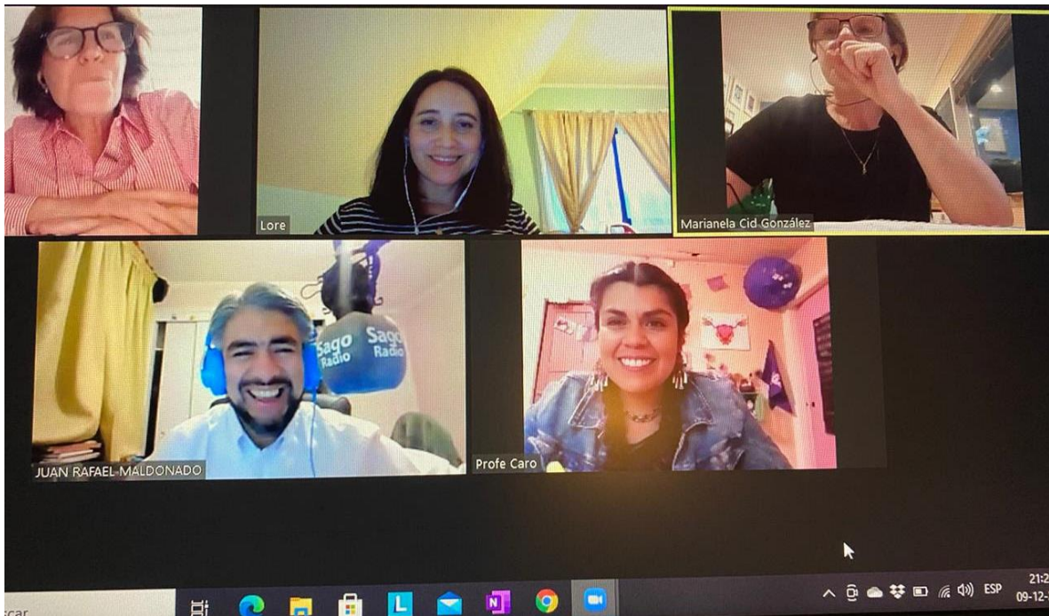
Imagen 3: Espacio radial "Escuela y Familia"