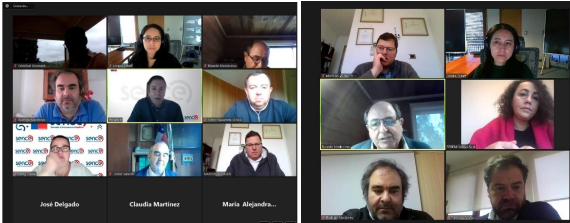
Imagen 12: Vinculación con el medio.