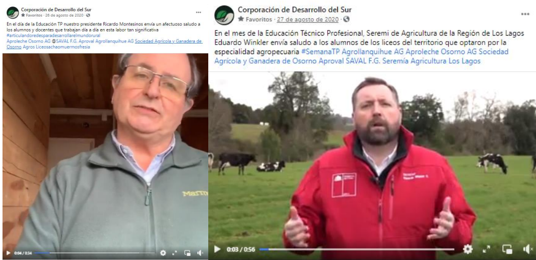
Imagen 9: Saludos del Presidente de la Corporación de Desarrollo del Sur y Seremi de Agricultura de la región de Los Lagos en la Semana Técnico Profesional